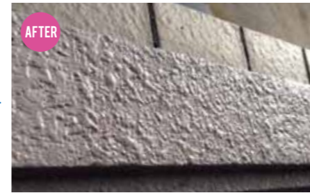
杉板コンクリート補修